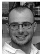
Responsabile sciovia Bede-Novaggio